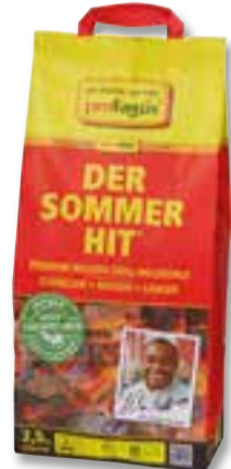
Der Sommer Hit Buchen Grillholzkohle Art.Nr.: 835456007

2,5 kg Sack (1 kg = 2,00 €) 6,99 je 4,99 GESPART 28%