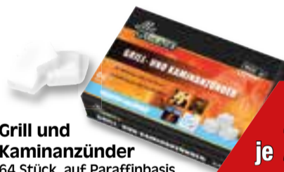
Grill und Kaminanzünder 64 Stück, auf Paraffinbasis zum sicheren und geruchsarmen Anzünden, Art.Nr.: 20832393