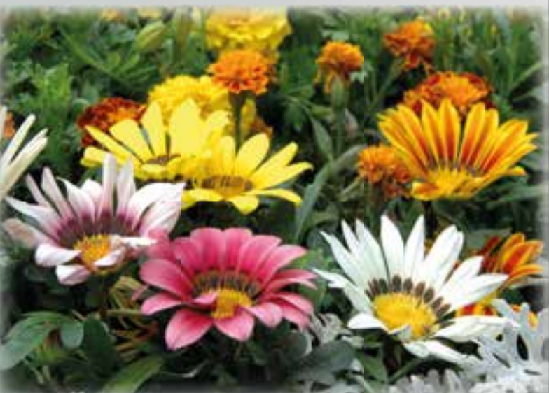
Gazania Mittagsgold in apartem Farbspiel, für vollsonnigen Standort, 12 cm Topf, Art.Nr.: 89000478