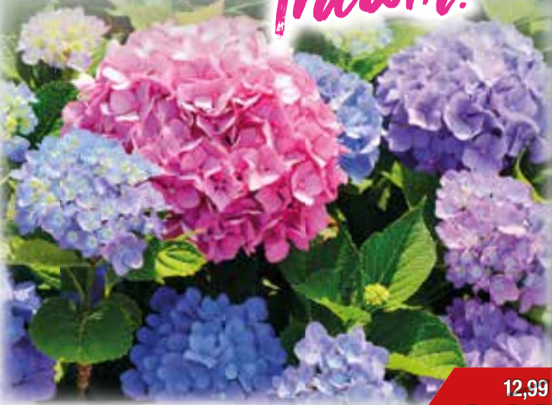
Gartenhortensie Hydrangea macrophylla, für halbschattigen Standort, verschiedene Farben, 23 cm Topf, Art.Nr.: 25043310