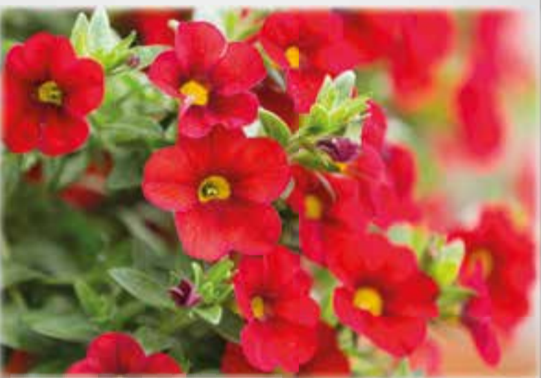
Kleinblumige Hängepetunie Million Bells überreiche Fülle kleiner Blütenglöckchen, 12 cm Topf, Art.Nr.: 89149007