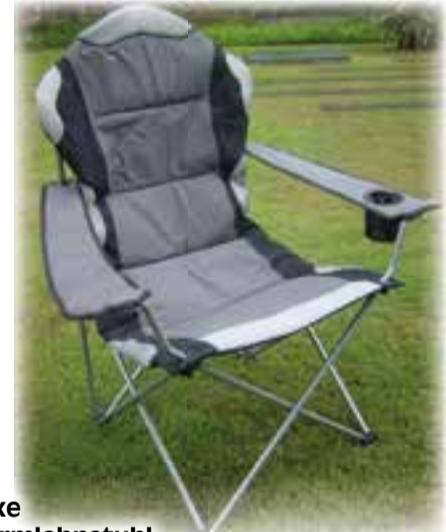
Deluxe faltarmlehnstuhl schwarz-grau, Stahlrohrgestell pulverbeschichtet, 600D Oxford, extra hohe Rückenlehne für hohen Sitzkomfort, inkl. Getränkehalter und Tragetasche, Art.Nr.: 4400241007

2,5 kg Sack (1 kg = 2,00 €) 6,99 je 4,99 GESPART 28%